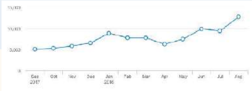
目标受众供需情况

查看特定人才库的供需及参与互动受众的洞察数据，使您能够更明智地分配预算并确认不同推广项目的优先级