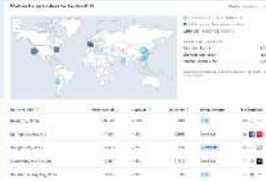
目标受众互动参与情况