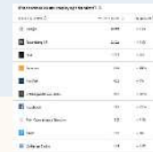
有领先优势的雇主